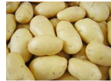
(أ) تؤكل مطبوخة