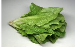
(ج) تؤكل نيئة

٦- ميز صور الخضراوات الآتية بكتابة عبارة (تؤكل نيئة) أو (تؤكل مطبوخة) أسفل كل صورة: