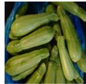
(هـ) تؤكل مطبوخة