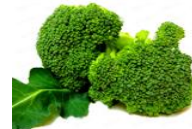
(د) تؤكل مطبوخة