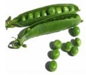
(ب) تؤكل مطبوخة