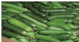
(و) تؤكل نيئة