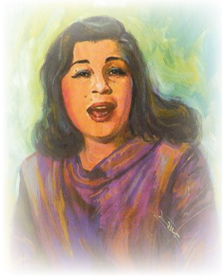
الشَّاعِرَةُ عَزِيْزَةُ هَارُون