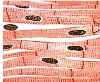
خلايا عضلية قلبية

تختلف الخلايا النباتية والحيوانية في الصور السابقة من حيث: الشكل، والحجم، والوظيفة التي تؤديها.