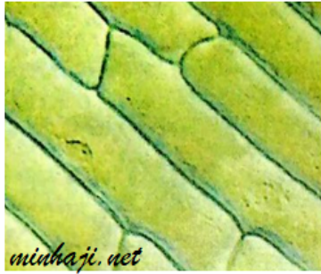
خلايا قشرة البصل