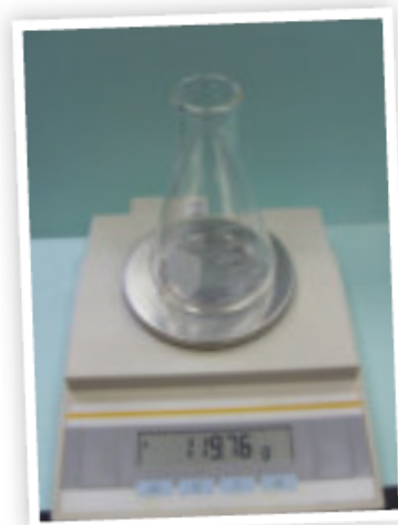
قراءة الميزان = ١١٩,٧٦ جرام