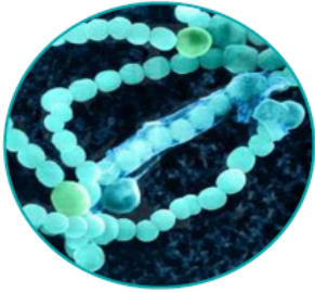
بكتيريا خضراء مُزْرَقَة

• تأمل الصور الآتية لبعض خلايا البكتيريا كما تظهر تحت المجهر الإلكتروني.