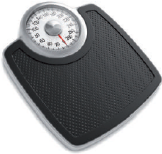
▲ ميزان منزلي.