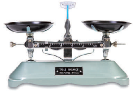
▲ ميزان ذو كفتين.