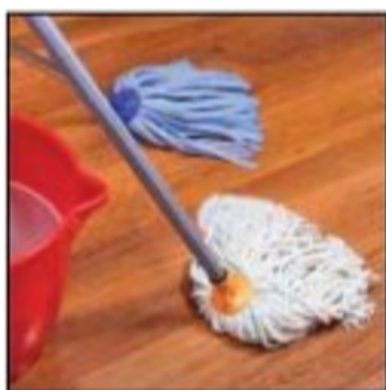
مسح الماء عن الأرضيات