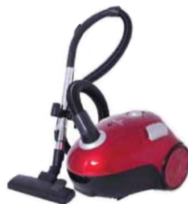
كنس السجاد بصورة آلية