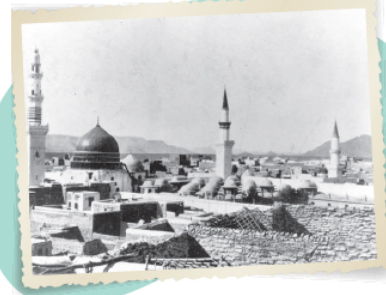
صورة المدينة المنورة عام ١٣٢٦هـ