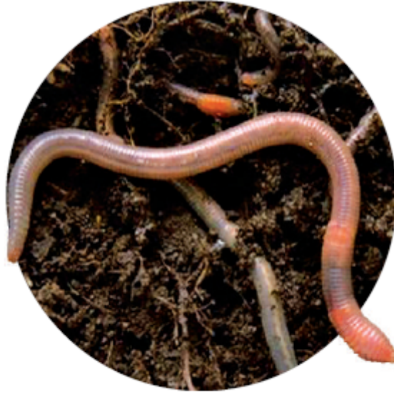
دودة الأرض من الديدان الحلقية.