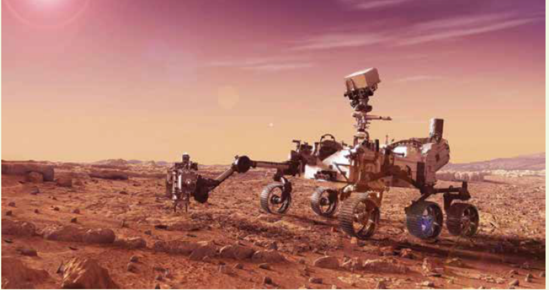
▲ مركبة استكشاف سطح المريخ.

أفسر كيف تستطيع مركبة استكشاف سطح المريخ إرسال الصور والمعلومات من هناك إلى المحطة الأرضية في كوكب الأرض.