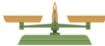
الميزان ذو الكفتين