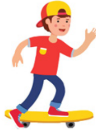
حركة لوح التزلق