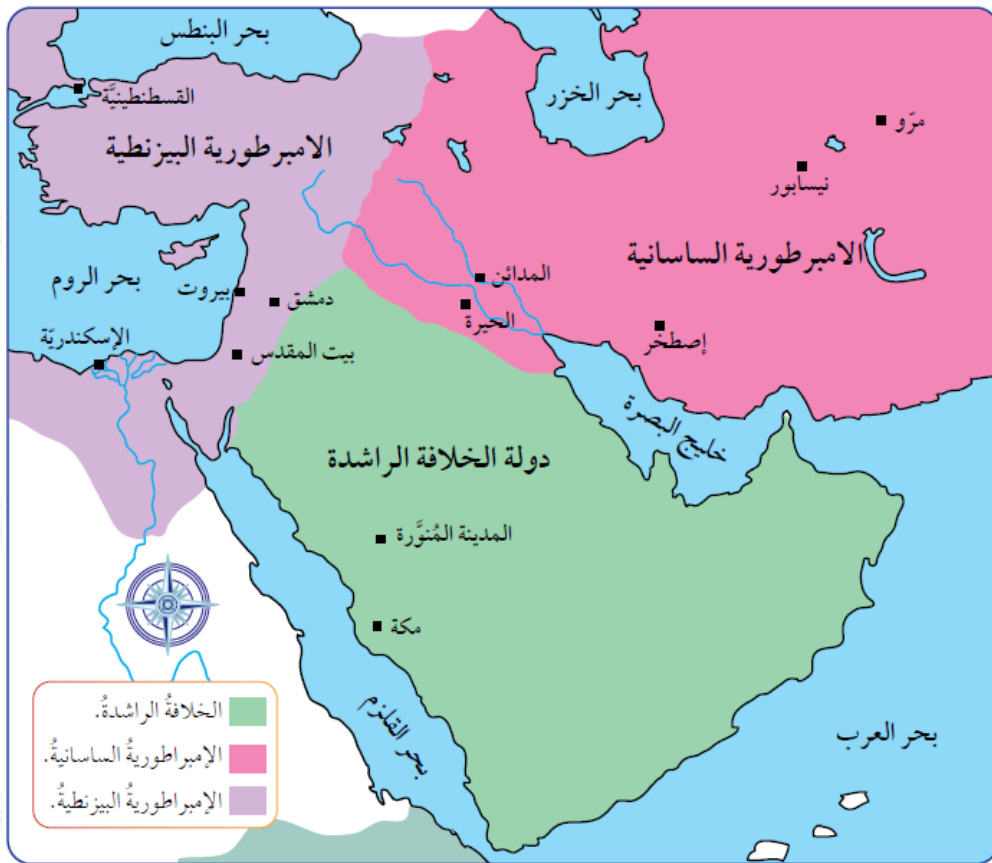
الشكل (5): خريطة الإمبراطورية الساسانية.

أتأمل الخريطة الآتية التي تبين امتداد الدولة الساسانية، ثم أجب عن الأسئلة التي تليها: