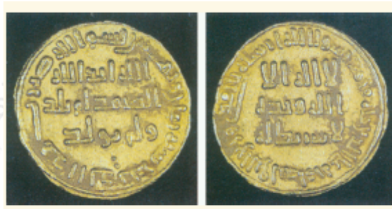
شكل (٣٠) نقود إسلامية قديمة