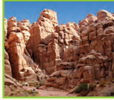
الحجر شيء غير حيّ