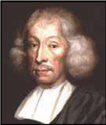
جون راي (1627 - 1705 م)

صنّف النباتات إلى مجموعات بناءً على أوجه التشابه والاختلاف بينها، وهو أول من أشار إلى مفهوم النوع Species .