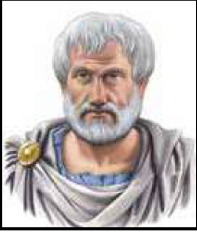
أرسطو (322 - 384 ق.م)