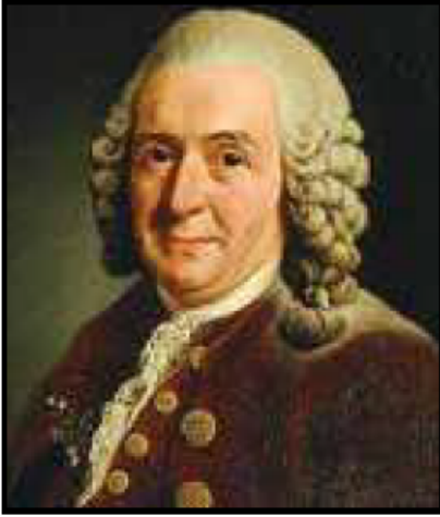
كارلوس لينيوس (1707 - 1778 م)

وضع أسس التصنيف العلمي الحديث، ونظام التسمية الثنائية للكائنات الحية.